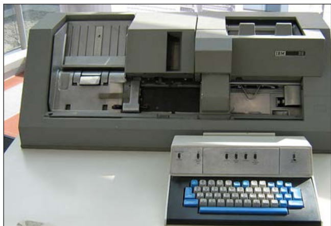
FIGURA 3. Perforadora de fitxes IBM 29.

El 1971, el Ministeri d'Educació i Ciència va adquirir un ordinador Univac 1108, que va instal·lar al recentment creat Centro de Proceso de Datos, situat al carrer de Vitrubio de Madrid. S'hi van connectar diverses universitats, entre les primeres, la Universitat Politècnica de Barcelona (avui, Politècnica de Catalunya), a través d'un terminal DCT-2000 a l'antic edifici del rectorat, que va ser operatiu des del 1973. Hi portàvem els paquets de fitxes, de programes o de dades, i uns dies després hi recollíem els resultats. Encara que avui sembli increïble, va representar un progrés notable respecte a la capacitat dels centres de càlcul locals. Afortunadament, la informàtica anava evolucionant ràpidament i el cost de l'equipament cada cop era més accessible, de manera que a la dècada dels vuitanta els grups de recerca es van poder anar dotant del seu propi equipament.