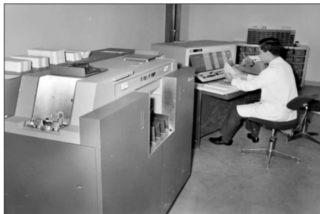
FIGURA 2. Ordinador 1620 de la Universitat de València (UV).

L'IQS, a finals dels anys seixanta, disposava d'un ordinador IBM amb 16 kilobytes (kB) de memòria (sí, 16 kB!), en una instal·lació que ocupava tota una sala. Durant la dècada dels seixanta, algunes universitats s'havien anat dotant de centres de càlcul, amb ordinadors IBM 360, IBM 1620... de 32 kB, 64 kB o 128 kB de memòria, unitats de disc addicionals, unitat lectora de fitxes o impressora de paper continu. La figura 2 mostra la primera instal·lació del centre de càlcul de la UV. La comunicació amb l'ordinador es feia a través de fitxes perforades. Tots els centres de càlcul tenien almenys una perforadora, com la que es mostra a la figura 3.