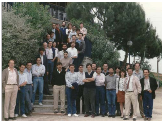
FIGURA 5. V Reunió del Grup de Químics Quàntics de Catalunya, Bellaterra, 1989.

pre un paper protagonista en les reunions successives. A les reunions hi assistien també col·legues de Castelló i de València, on es va fer alguna de les reunions. La Secció de Ciències de l'IEC va mantenir uns pocs anys més el seu suport.