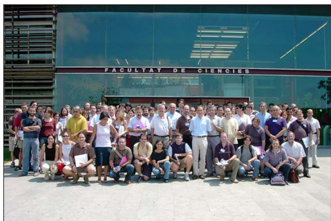
FIGURA 6. XIX Reunió del Grup de Químics Quàntics de Catalunya, Girona, 2003. Fotografia efectuada i cedida per Miquel Duran.

La Generalitat de Catalunya va crear el programa «Xarxes temàtiques» i ens hi vam acollir l'any 1994, amb la Xarxa de Química Teòrica, que ja s'estenia a dotze grups, amb activitats centrades no solament en els mètodes quàntics. El finançament era limitat i calia sol·licitar-lo cada any, però permetia continuar organitzant la reunió anual sense ensurts, tot i el creixement constant del col·lectiu, que, a la reunió de l'any 2002, va aplegar 183 participants de vint-i-dos grups. A la figura 6 es mostra una fotografia del col·lectiu a la XIX Reunió, celebrada a Girona l'any 2003.